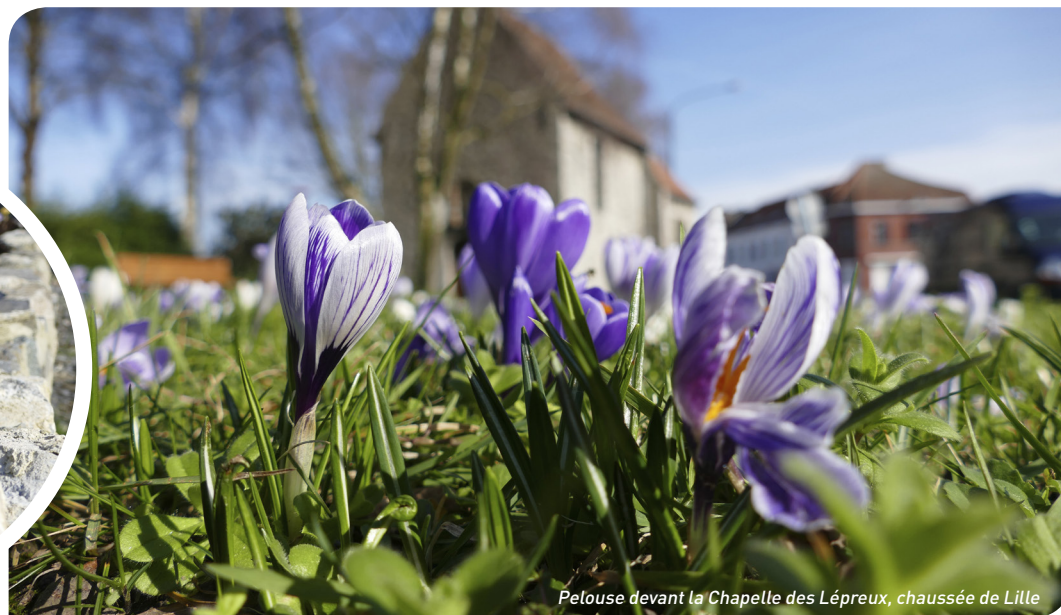
Pelouse devant la Chapelle des Lépreux, chaussée de Lille

année, ont été plantés par des bénévoles avec le concours du service des Espaces verts. Chapelle des lépreux, résidence Lelubre d'Orcq, rond-point Imagix, église de Blandain, vestiges de l'ancienne citadelle, boulevard Albert, avenue de Troyes, château de Vaulx... : ils ont tous été « bulbés ». ■